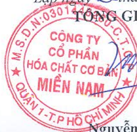
Nguyễn Hữu Thọ