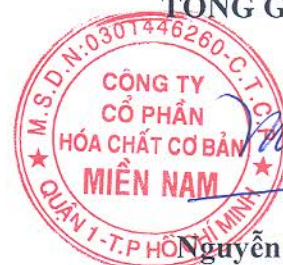
Nguyễn Hữu Thọ